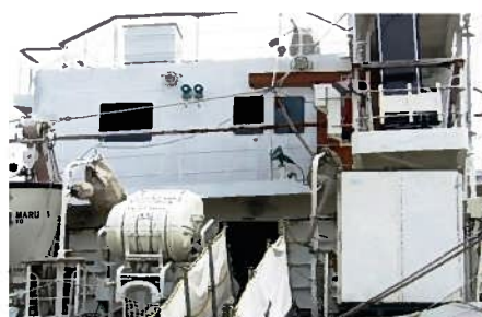
海王丸のいかだとシューター